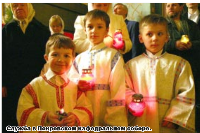
Служба в Покровском кафедральном соборе.