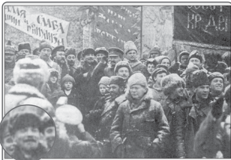
22 апреля в советское время вся страна отмечала день рождения Владимира Ильича Ленина. В связи с этим хочу рассказать о восставшей из пепла в наши дни истории вербовки Ленина германским Генеральным штабом.

30 марта (12 апреля) 1917г. путники достигли Засница на побережье Балтики, откуда на шведском грузовом пароходе прибыли в