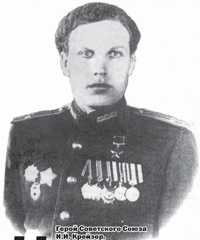
Герой Советского Союза И.И. Крейзер.