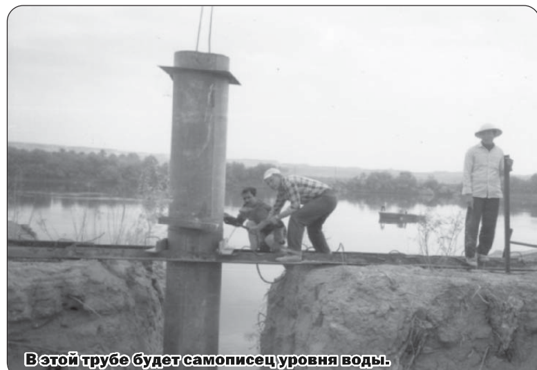
В этой трубе будет самописец уровня воды.

Трудно было перетаскать через Евфрат полкилометра троса, который весило около полутонны. Пришлось вкапывать в землю два швеллера с прорезами для металлической оси, проходящей через барабан, на который был намотан трос. С помощью крана огромная бухта была помещена на швеллеры. С этого приспособления трос можно было привязывать к лодке и, постепенно разматывая, двигать к противоположному берегу.