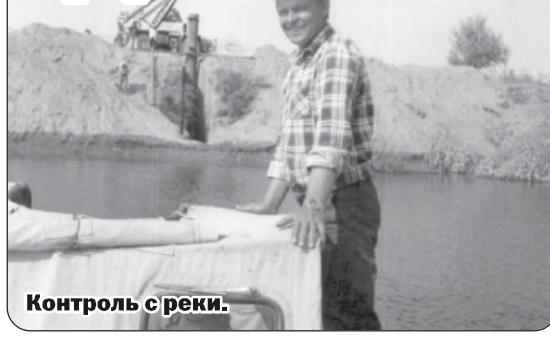
Контроль с реки.