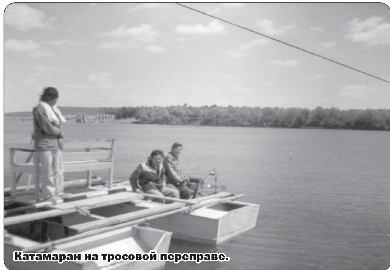
Катамаран на тросовой переправе.

Вот так неожиданно меня «составили» на роль эстрадного певца. И я стал петь, не поверить? – под ансамбль! Исполнял «Летят утки...», «На границе часто снится...», «Плот» Юрия Лозы, «Что так сердце, что так сердце разтревожено...». «Задремал под ольхой есаул молоденький...» В шутку мне даже присвоили звание «Народного