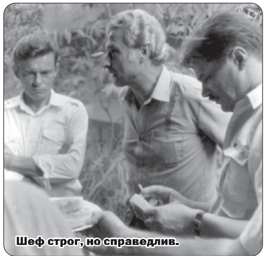
Шеф строг, но справедлив.