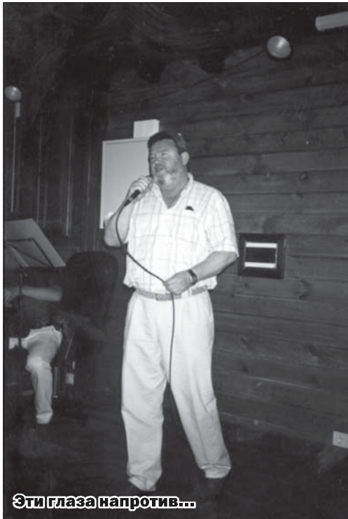
Эти глаза напротив...