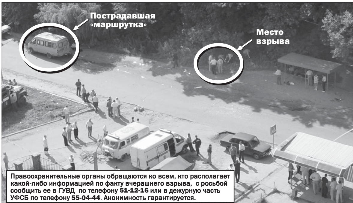
Пострадавшая «маршрутка» Место взрыва

Как сообщили «ВН» в группе общественных связей управления ФСБ по Воронежской области, в результате взрыва погибла 26-летняя женщина, еще несколько человек, находившихся в момент взры-