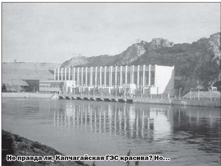
Не правда ли, Капчагайская ГЭС красива? Но...

Мысль о диссертации возникла по двум причинам. В то время ученая степень давала возможность существенно улучшить материальное положение. Диплом кандидата наук в шутку именовался «хлебной карточкой». С другой стороны, природные связи в Или-Балхашской водной системе на-