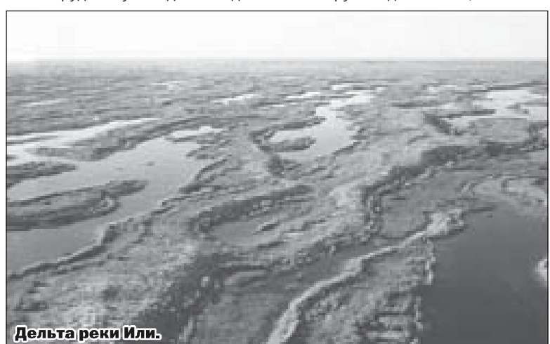
Дельта реки Или.