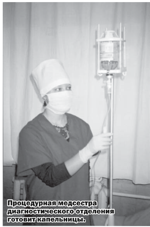
Процедурная медсестра диагностического отделения готовит капельницы.

Сергей ЛАВРЕНТЬЕВ. Окончание в следующем номере.