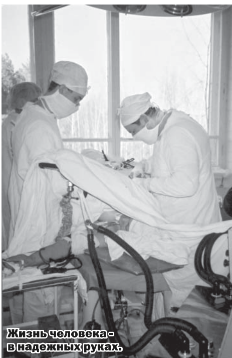
Жизнь человека - в надежных руках.

- Точно так же, как и больные костно-мышечной системы - в группе риска костного туберкулеза и так далее. А поскольку вы начали говорить о диагностическом отделении, я хотела бы добавить несколько слов. Наш диспансер является крупным консультативным лечебно-диагностическим центром для больных с легочной патологией. Больные, у которых заподозрен туберкулез, в первую очередь направляются в углубленном обследовании и диагностике. С этой целью в структуре диспансера в 1983 году создали диагностическое отделение на 70 коек. Отделение использует в своей работе новейшие достижения современной медицины. При выявлении туберкулеза больного переводят в хирургическое или терапевтическое отделение по легочному туберкулезу. В диагностическом остаются на лечение больные с острыми и хроническими бронхитами, пневмониями и т.п. Кстати, наше урологическое отделение тоже считается диагностическим, несмотря на