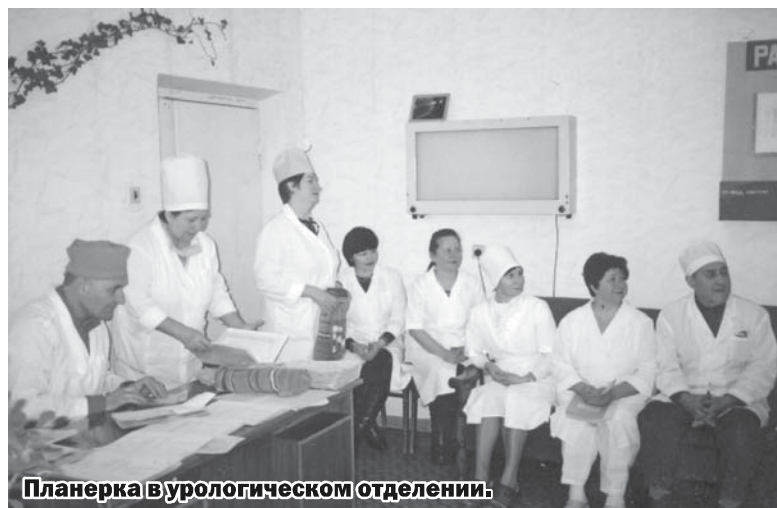
Планерка в урологическом отделении.

пациента в тубдиспансер. Я всегда повторяю, и вам уже говорила не раз: есть самый короткий путь - где бы человек ни проживал - это напрямую приехать к нам и проконсультироваться. Даже если кто-то не пошел в поликлинику, но есть подозрения, скажем так, на заболевание со стороны легких - не тяните время, приезжайте. Здоровье - самое дорогое, что есть у человека. Это наше достояние и