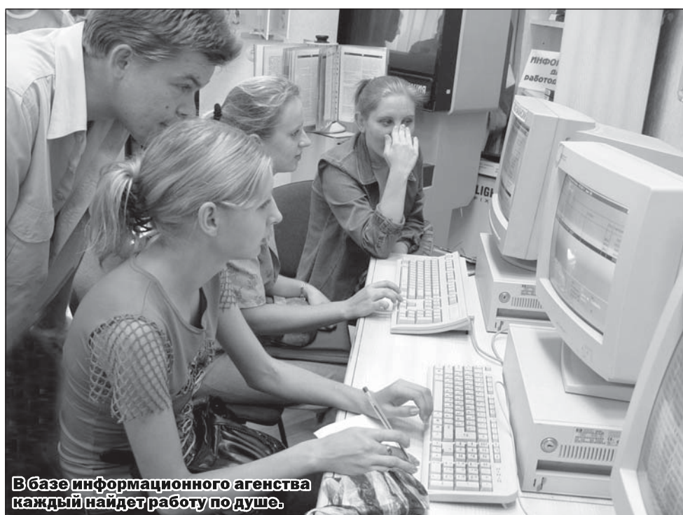
В базе информационного агентства каждый найдет работу по душе.

правильно действовать, человек нуждается в объективной информации, убеждены они.