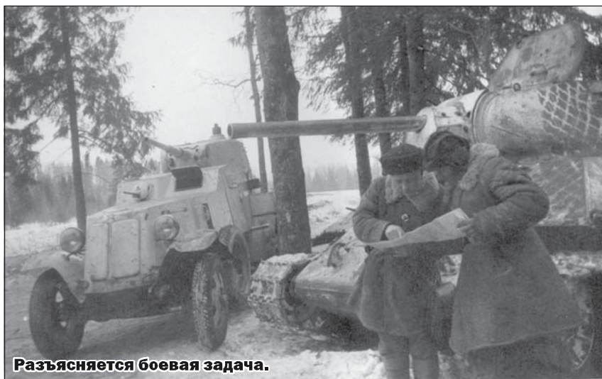
Разъясняется боевая задача.