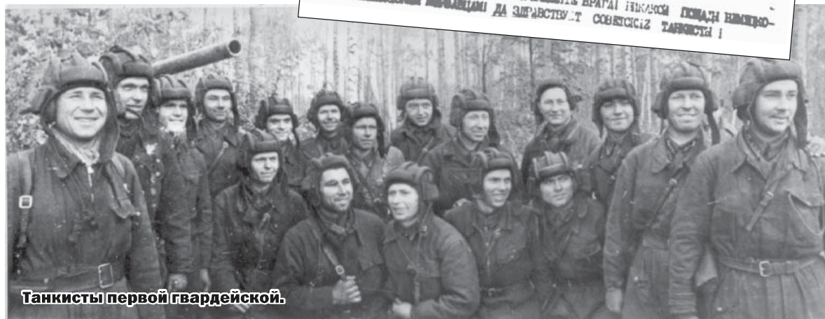
Танкисты первой гвардейской.

Передо мной – старые пожелтевшие страницы военной газеты – боевого листка 1-й гвардейской танковой дивизии. Скольких трудов стоило военным журналистам в промежутках между боями, где они сами участвовали, написать и размножить на ротаторе драгоценные страницы! Зато солдаты и командиры получали свежие репортажи о подвигах своих товарищей и информацию о положении на фронте.