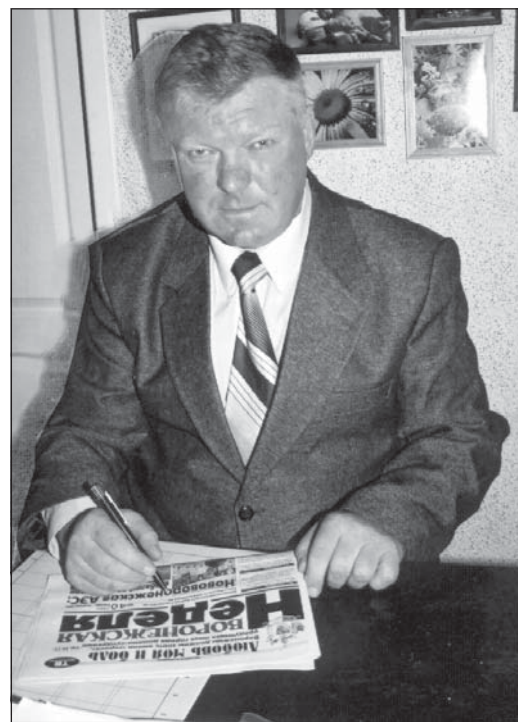
обслуживание и установку.

Мороженое «Мягкий Айсберг» представлено в средней ценовой нише, но при качестве класса