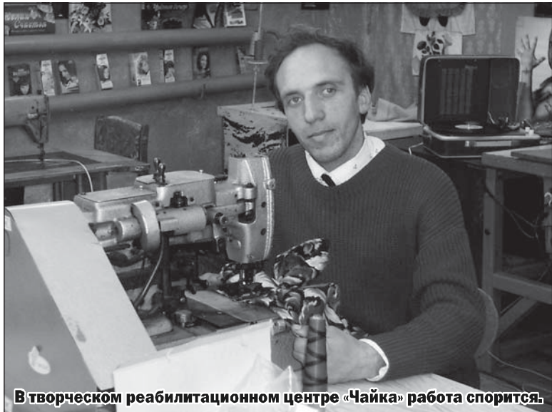
В творческом реабилитационном центре «Чайка» работа спорится.