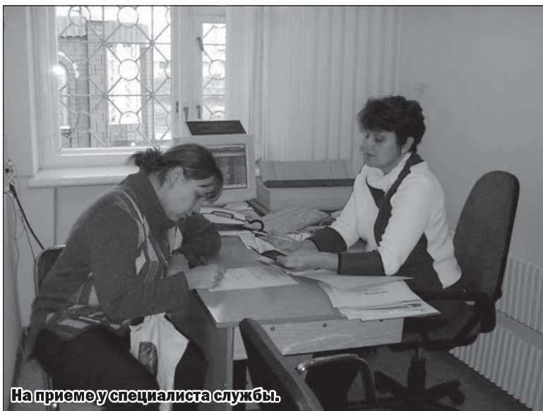
На приеме у специалиста службы.