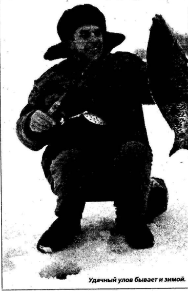
Удачный улов бывает и зимой.

предприятий сахарной промышленности, накопившиеся на полях фильтрации, с которых возможна их утечка. Весьма скверно, как в зимний, так и в летний периоды, работают очистные сооружения райцентра Анна, стоки которых практически без очистки отводятся в реку Анна, а затем в Битюг — одну из красивейших рек нашего края. Не уживается с рекой Сухая Чигла и райцентр Таловая, превратив ее в черту поселка в сточ-