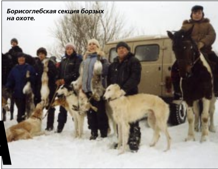
Борисоглебская секция борзых на охоте.