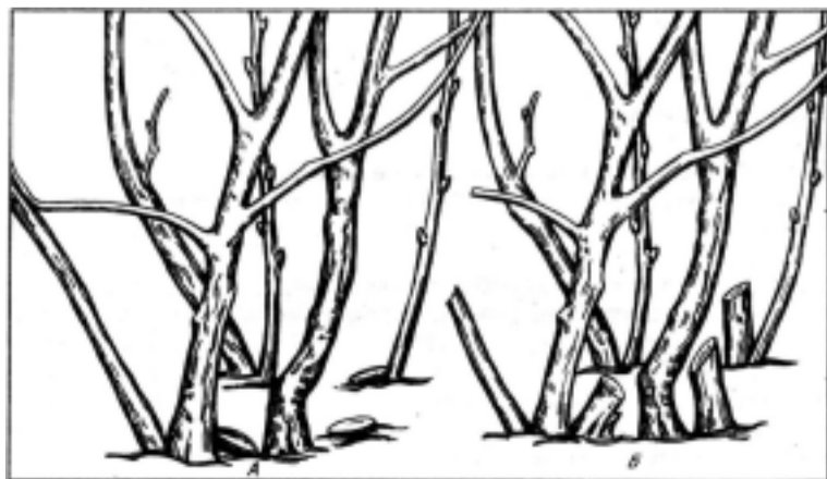
Техника обрезки черной смородины (слева правильная, справа неправильная: оставлены пенки).

Также и с виноградом. Если вы уже полностью обрезали и сформировали лозу, непременно обработайте ее трехпроцентным раствором железного купороса во избежание возникновения грибных болезней. Наклоните лозу к земле и пришпильте согнутой буквой «П» толстой проволокой, но так, чтобы между пучком лозы и грунтом оставалось проветриваемое пространство. Прикройте куском рубероида.