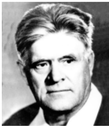
Черенков П.А. Премия в области физики 1958 года.

«Может ли русский писатель жить и писать вне России?» – спросила его одна знакомая. «Да, - ответил Бунин, - иные не могут, если нет глубочайшей и ничем не рушимой связи с прошлым, кровной связи с Русью. А иные могут». У него эта связь – связь кровная – была. «Все корни мои, ушедшие в русскую почву, - страдал писатель в эмиграции. В 1926 году произведения Ивана Бунина прочитал взыскательный Ромен Роллан и, прочитавши, предложил его кандидатуру на соискание Нобелевской премии. Несколько лет влиятельнейшие светила мировой литературы «продвигали» эту фамилию, а с 1930 года Бунин номинируется на премию ежегодно.