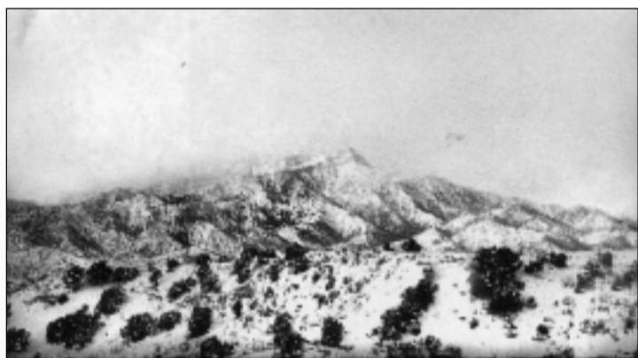
Высота 3234. Здесь проходил жестокий бой десантников 9-й роты с противником в ночь с 7 на 8 января 1988 г.

расхождение правды с сюжетом фильма) ближайшему подкреплению нужно было пройти солидное расстояние.