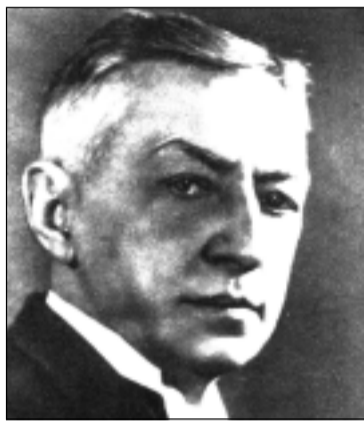
Бунин И.А. Премия в области литературы 1933 года.

го как писатель. Первая книга рассказов у него вышла в 1897 году, там – «Весть с Родины», «На краю света», «Танька» и другие его произведения. Знаменитые «Антоновские яблоки» напечатаны в 1900-м, в том же году «Эпитафия», в 1911 году изданы великолепные повести «Деревня» и «Суходол». В его тогдашнее окружение входили писатели, вышедшие из городских сословий, но массовый читатель скорее принимал Бунина-деревенщика, нежели молодого урбаниста. Тема деревни занимала основное место в бунинской прозе вплоть до 1914 года. Вызовы нового времени, взбудораженного мировой войной, проявились у него ощущением катастрофичности человеческой жизни, несбыточности и суетности поисков человеком «вечного счастья» («Братья» – 1914 год, «Чаша жизни» и «Господин из Сан-Франциско» - 1915-й).