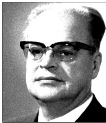
Басов Н.Г. Премия в области физики 1964 года.

Как-то в начале восьмидесятых годов мне, автору этих заметок, довелось сопровождать финского коллегу-журналиста в поездке на Нововоронежскую атомную электростанцию. Инженер, которому поручили нас, предложил спуститься