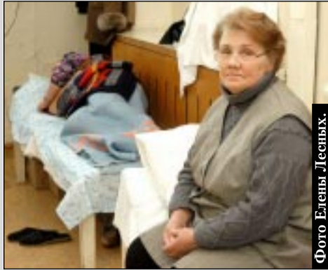
Голодающие в заводской медсанчасти.

УВЕЛИЧИЛОСЬ КОЛИЧЕСТВО РАБОЧИХ ОАО «ВЭКС», ОБЪЯВИВШИХ ГОЛОДОВКУ В СВЯЗИ С НЕВЫПЛАТОЙ ЗАРПЛАТЫ. 7 человек, в основном женщины, пошли на крайние меры, потому что нечем кормить семьи. Это уже не первый случай голодовки. Рабочие, прибегшим к голодовке ранее, уже выплатили долги по зарплате. Видимо, это обстоятельство и стало решающим толчком к очередной «голодной» забастовке.