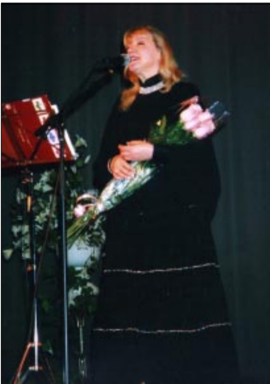
Жанна Бичевская. Белая ночь...

В Костомаровском монастыре закончилась реставрация храмов. Цветы от Жанны Бичевской, как и в прошлом году, возложены к мощам св. Митрофана в Покровском соборе.