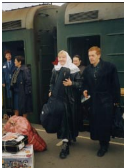
Встреча на воронежской земле.

Недавно наш город посетили народная артистка России Жанна Бичевская и композитор Геннадий Пономарев. Сразу с вокзала они поехали в Покровский собор, чтобы поклониться мощам святителя Митрофана Воронежского. Вечером того же дня в филармонии состоялся концерт. Читатель, видимо, уже знает, как он прошел, а вот о творчестве этих двух талантливых людей, а также о том, что связывает автора этого материала и газету «Воронежская неделя» с именем Жанны Бичевской, мы и хотим вам рассказать.