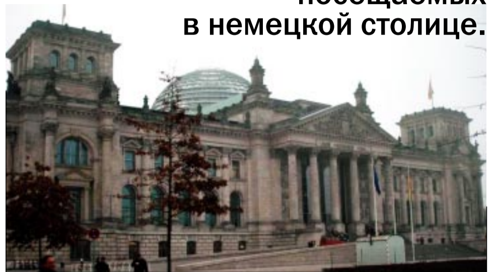
Здание рейхстага. Надпись на фасаде в переводе на русский – «Немецкому народу».

Это историческое здание сегодня – одно из самых посещаемых в немецкой столице.