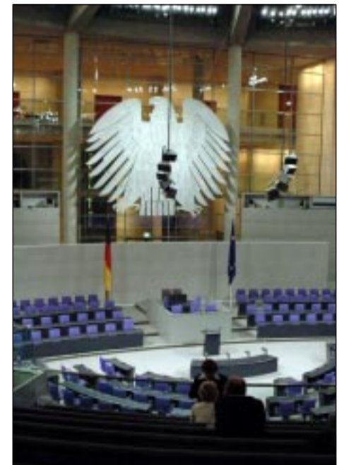
Здесь заседает бундестаг.