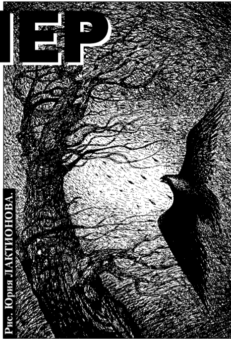
Рис. Юрия ЛАКТИОНОВА

Конечная остановка была недалеко, когда, заметив светящееся кафе, мы вышли. От мини-концерта повеяло чувством голода. А также огромный прилив сил, которые я растрчивал на разговор. Неважно, на