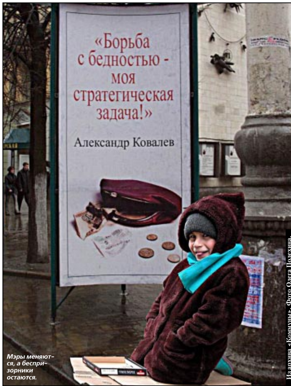
Мэры меняются, а беспризорники остаются.

- Определенно, второй вариант. Одна молодая мама, приехавшая из Донецкой области, призналась, что день нищенства приносит 400 рублей дохода. На такие деньги и квартиру можно снять у какой-нибудь бабушки, и прожить неплохо. Выгоняешь этих бизнесменов из одного района, - смотришь, а они уже в другом.