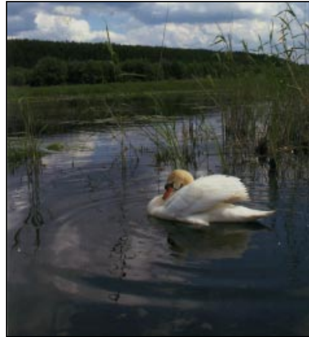
Лебеди на озере Гаврик.