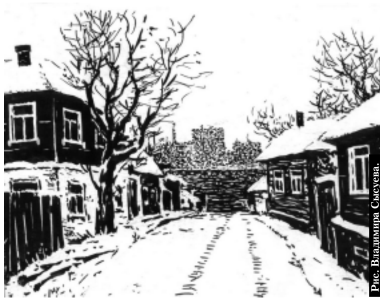
Рис. Владимир Сысуев.

На столе появилась заиндевшая ноль семьдесят пять с относительной прозрачностью. Стаканы зазвенели, стало жарко, все разом заговорили.