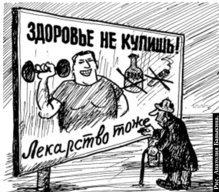
Рис. Анастасия Бавыкина.

В ходе селекторного совещания представители регионов высказали свои предложения по улучшению ситуации с льготными лекарствами. По словам руководи-