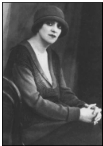
«Я переспала со многими театрами, но так и не получила удовольствия».

Об этой неповторимой актрисе написано уже столько, что ее биографию написали чуть ли не по минутам. Добавить или найти иные слова, которые бы описали ее харизматичную личность и неповторимый талант, уже очень трудно. И сегодня мы хотим еще раз вспомнить ее юмор, ее острые фразы. Раневская, как никто другой, умела сделать из трагедии комедию, смеяться над бедностью, одиночеством, старостью и самой смертью. Трудно припомнить еще хоть одного человека, из уст которого вышло такое количество крылатых фраз, афоризмов, о котором ходило бы столько баек и анекдотов.