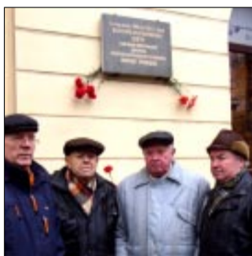
Мемориальная доска В.К. Довгер.

В прошлом году в канун Дня чекиста в Воронеже была открыта мемориальная доска Валентине Довгер, сподвижнице Героя Советского Союза Николая Кузнецова. Публикации о Валентине Довгер в СМИ имели существенные неточности, что дало основание предположить: имя легендарной разведчицы стало забываться. Авторы публикации взяли на себя труд восстановить историческую правду.