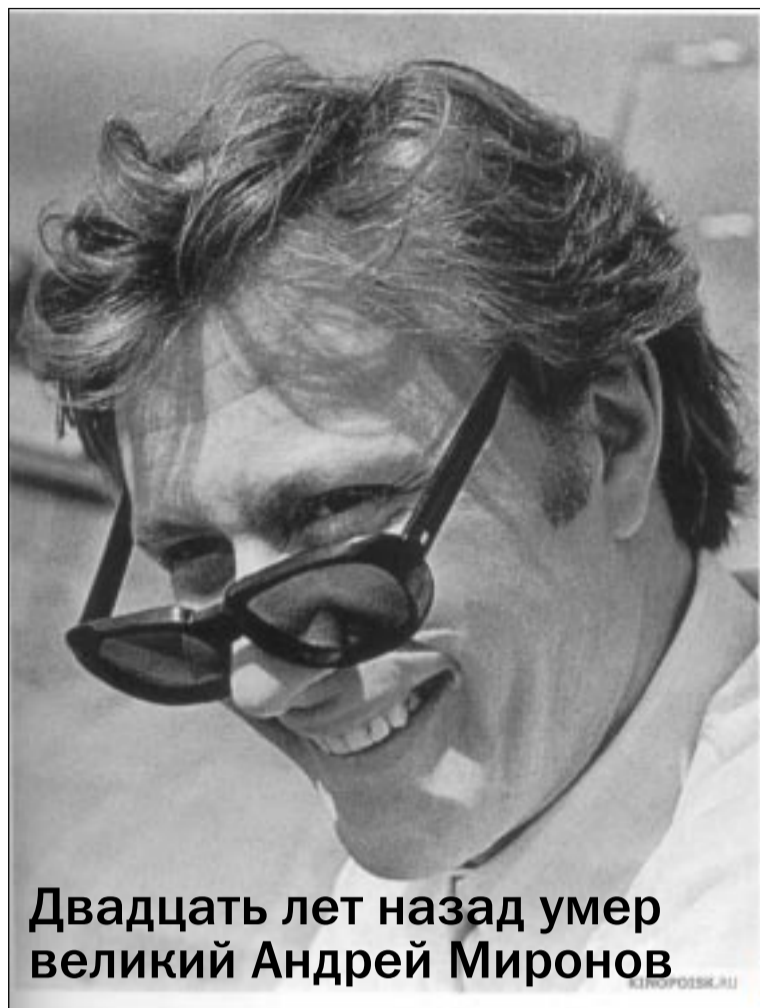
Двадцать лет назад умер великий Андрей Миронов

Как вспоминает его партнер по спектаклю Александр Ширвиндт, последней репликой Миронова были слова: «Да! Мне известно, что некий вельможа одно время был к ней неравнодушен, но то ли