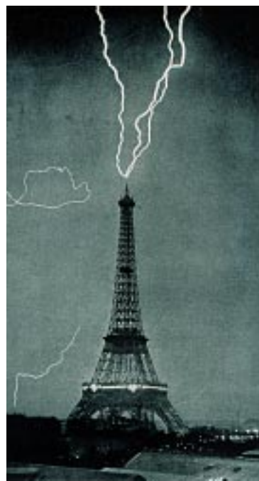
Молния бьет в Эйфелеву башню. Фотография 1902 г.