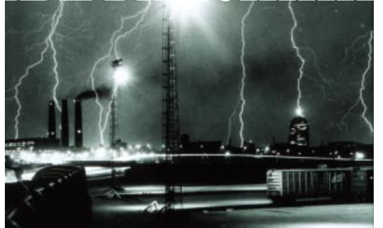
Множественные молнии. Бостон, 1967 год.

Иногда молния по одной ей ведомой причине из группы людей выбирает самого радостного или красивого, а может, и самого греховного - в строгом соответствии с древними легендами о гомемеразящем... Спряталась вся бригада, человек пятнадцать, под дерево, молния нашла только бригадира... В Японии до сих пор не могут объяснить причину страшной