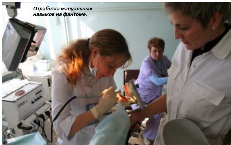
Отработка мануальных навыков на фантоме.

Правда, выпускники – и это реалии нынешнего времени – охотнее идут туда, где платят больше. Но у нас действует и система распределения, прежде всего тех, кто поступил в вуз по целевому набору из соседних регионов, а мы готовим кадры для Липецкой, Тамбовской, Белгородской областей. Своим подопечным мы стараемся создать оптимально комфортные условия для быстрой адаптации к учебному процессу.