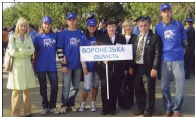
Делегация Воронежской области