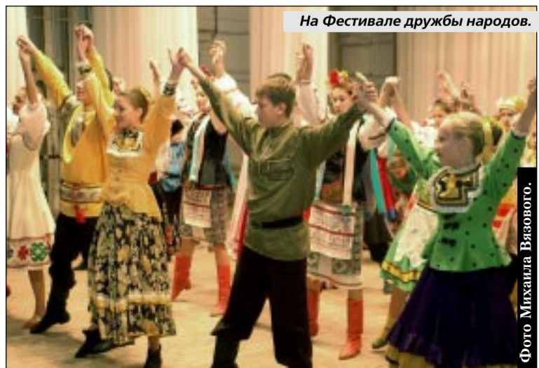
На Фестивале дружбы народов.