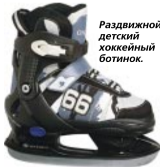
Раздвижной детский хоккейный ботинок.

В идеале ботинок должен сидеть плотно, если на ноги ребенка надеты колготки и одна пара шерстяных носков. Особое внимание стоит обратить на крепления и заточку лезвия. Неправильный крепеж может запросто привести к искривлению ноги ребенка.