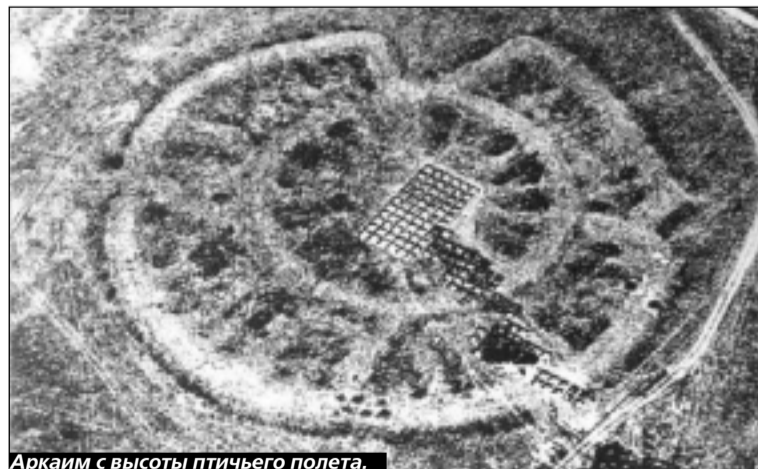
Аркаим с высоты птичьего полета.

тасты, специалисты, работающие на пересечении разнообразных научных дисциплин, а также философы и геополитики со всех концов света. Кого-то потянуло на «родину Заратустры», кого-то — в параллельные миры, ведь Аркаим фантастически раздвигал границы времени и пространства, заново переписывая облик наших предков, блиставших разумом, талантом и волей почти 50 веков назад! И все ученые отмечали истинное фантастическое воздействие на человека этой земляной чаши и завораживающих сферических строений.