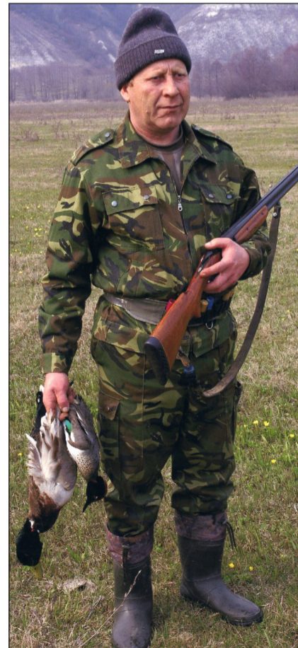
Фото Михаила Волкова.