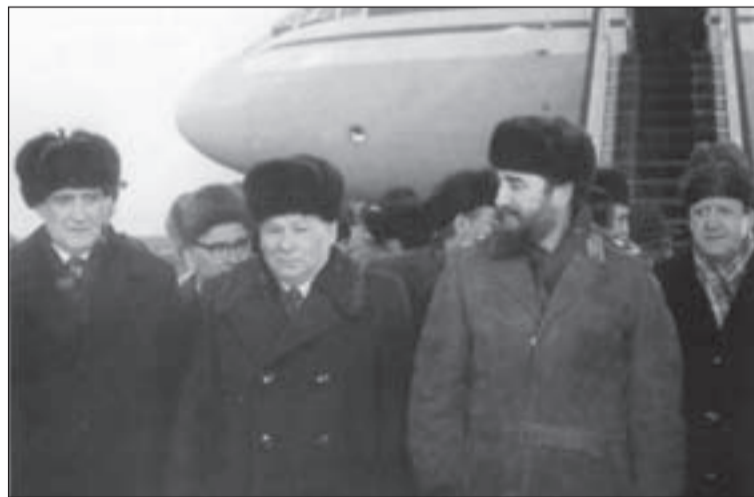
Встреча делегации КП Кубы во главе с Ф.Кастро в аэропорту «Внуково-2», прибывшей на XXVI съезд КПСС. Слева: В.И.Долгих, К.У.Черненко, Ф.Кастро, В.И.Воротников. Москва, февраль 1981г.

В это время Виталий Иванович почти четыре года работал в должности первого заместителя Председателя Совета Министров РСФСР М.С.Соломенцева. Сюрпризом для Виталия Ивановича были не только перевод его на новую, незнакомую для него дипломатическую работу, но и сама страна, в которую он направлялся, - Куба. И вполне естественно сразу возник вопрос: что и кто стоит за таким решением? Если это желание «верха» поощрить за хорошую работу, то проще и веселее было бы повысить его в должности, т.е. сделать Председателем Совмина РСФСР, а если... Но не будем гадать за самого Виталия Ивановича, углубляясь в его догадки и суждения: что да кабы... Дело это весьма сложное и трудно угадываемое. Сообщим лишь о том, что в момент объявления о новой должности В.И.Воротников временно исполнял обязанности Председателя (М.С.Соломенцев получил отпуск и уехал на юг), а в это время на европейскую часть России, в том числе и на Москву,