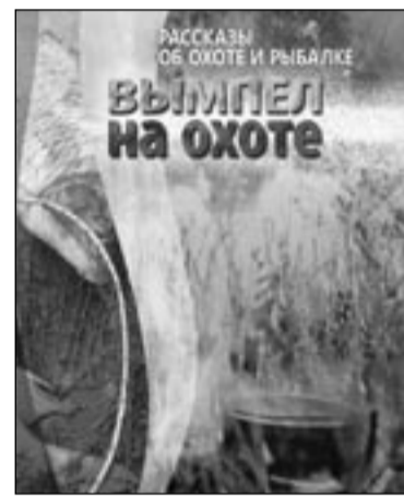
Книга, вобравшая в себя лучшие работы читателей «Воронежской недели» и ставшая лауреатом Всероссийского конкурса.

Награда Росохотрыболовсоюза - это еще и оценка творчества