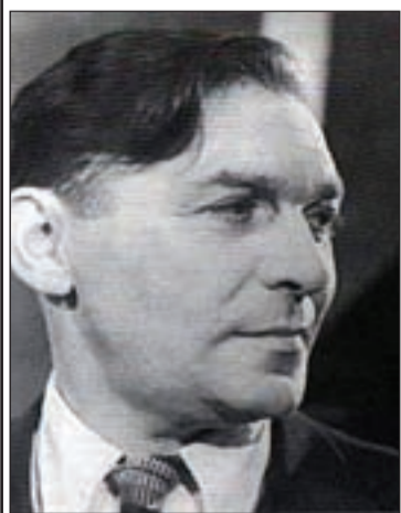
9 марта — день рождения Леонида Осиповича Утесова, певца, киноактера, руководителя джазового коллектива.