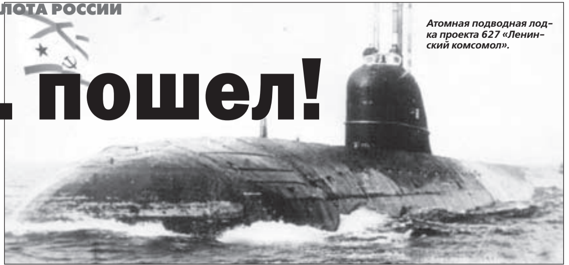
Атомная подводная лодка проекта 627 «Ленинский комсомол».

В феврале 58-го испытали трубозубчатый агрегат, турбогенератор, электрооборудование, а также выполнили разогрев паропроизводящей установки через парогенераторы. Комиссия во