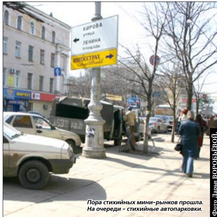
Пора стихийных мини-рынков прошла. На очереди – стихийные автопарковки.

«Дайте нам еще время, чтобы распродать товар и трудоустроиться!» – звучал призыв в адрес мэрии. Однако та не намерена отступать от «генеральной» линии по наведению порядка в городе. Во-первых, все торговцы были предупреждены о ликвидации «личного бардака» за две недели. Во-вторых, в Воронеже специально для женщин проводятся ярмарки вакансий – рабочие руки нужны и на производстве, и в сфере обслуживания. В-третьих, предпринимателям заранее был направлен перечень свободных мест на «цивилизованных» рынках. Этот перечень сходу был отвергнут: «Там хуже, там дороже, там мы будем чужими». А главный довод такой: «У нас товар покупали, значит, мы нужны городу и народу». Но в таком случае