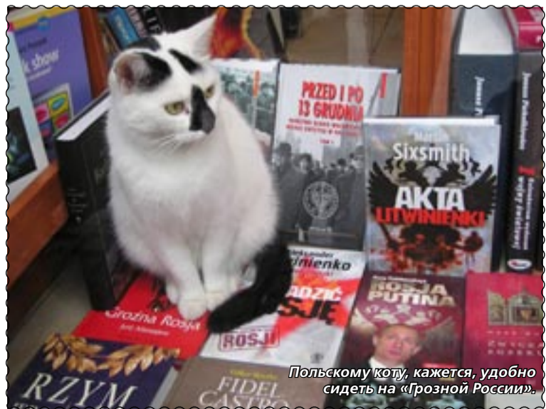
Польскому коту, кажется, удобно сидеть на «Грозной России».