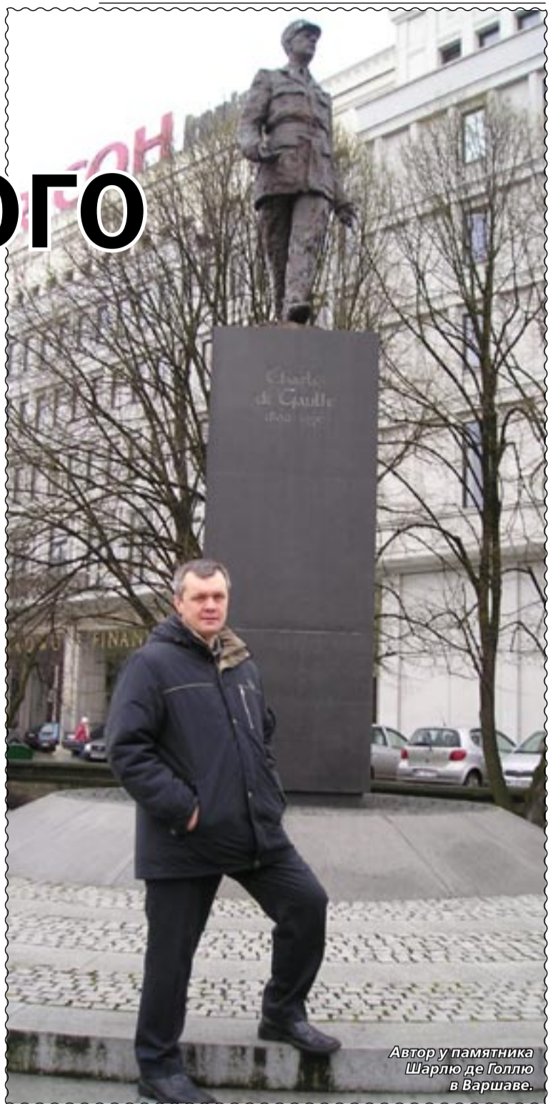
Автор у памятника Шарлю де Голлю в Варшаве.

«Железный занавес» приказал долго жить, границы в Европе открыты, но Польша не теряет своеобразие. Свободное перемещение в Шенгенской зоне вовсе не означает «стирание» границ и всеобщее братство, как многие считают в России. Во всяком случае, подавляющее большинство поляков не стремится менять место жительства на страны с более высоким уровнем жизни, к примеру, Францию или Германию, хотя юридические препятствия для этого нет. Однако, если вы попытаетесь провести знак равенства между польским фермером и немецким бауэром, то первый однозначно обидится и, в лучшем случае, посоветует вам «ехать к немцам за Одер» и там спрашивать о том, что вы бы хотели узнать. Во всем этом, скорее, не вражда или дух соперничества, а некая особая гордость за принадлежность