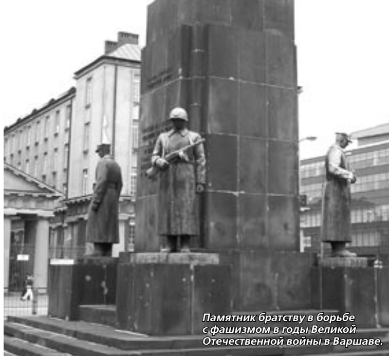
Памятник братству в борьбе с фашизмом в годы Великой Отечественной войны в Варшаве.

Демократия по-польски - это торг. В Сейме любой законопроект вызывает жаркие споры и проходит со «скрипом», но в итоге поляки имеют достойный уровень жизни с широким набором разного рода социальных льгот, позволяющий