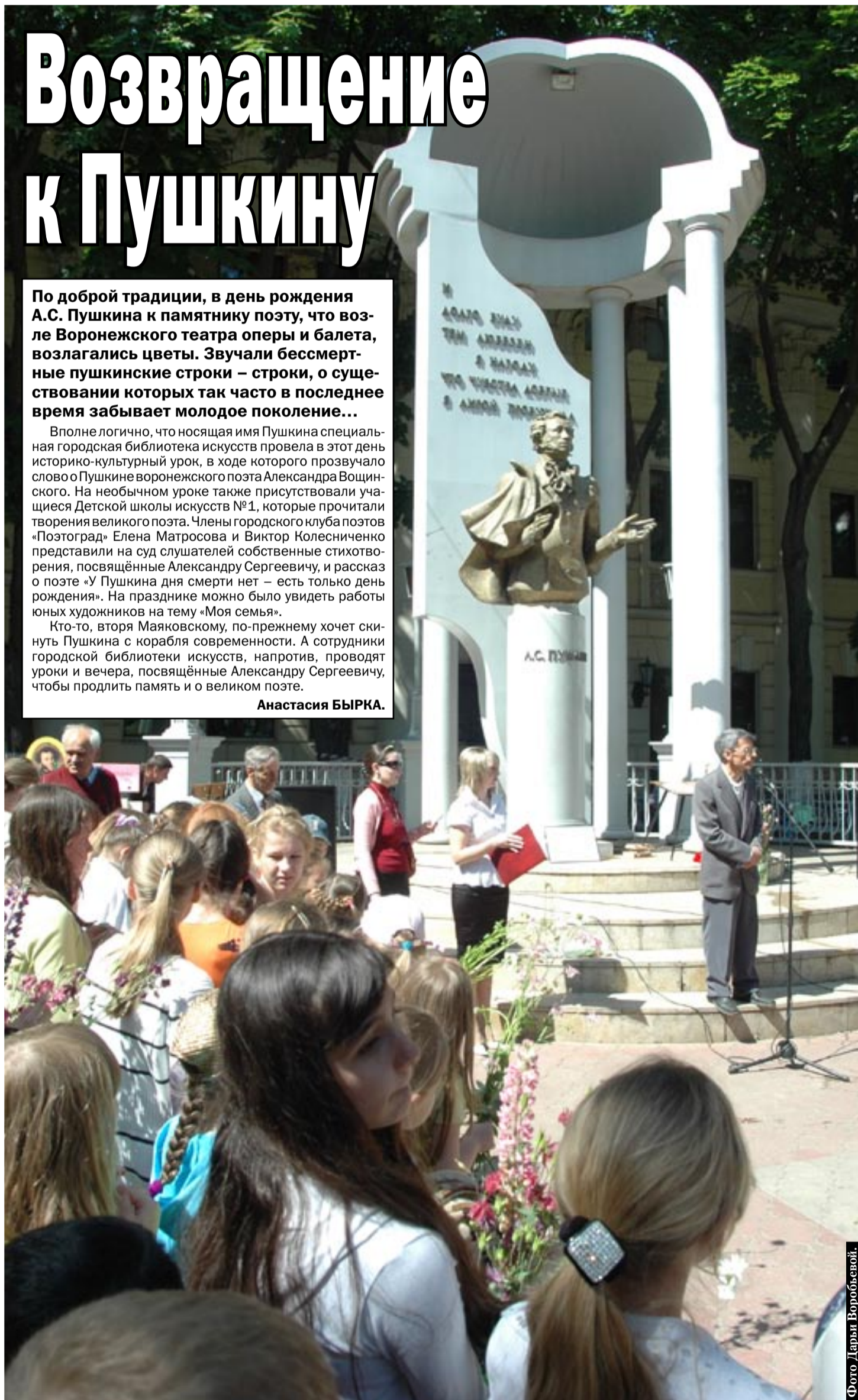
Фото Дарьи Воробьевой.