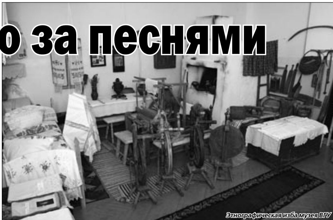
Этнографическая изба музея ВГУ

Базовыми селами были выбраны на этот раз Колыбелка и Нижняя Байгора. Студенты обследовали также близлежащие села — Верхнюю Байгору, Круч-Байгору и Луговатку. К сожалению, время неумолимо, и славившиеся на всю область певуны из Нижней Байгоры уже ушли из жизни. Но, тем не менее, исследовательская работа не была безуспешной. Записаны колыбельная песня с древним обрядовым сюжетом, несколько распевных семейно-бытовых и солдатских песен, мещанские романсы, частушки и страдания, наигрыши на рояльной гармонии. Благоприятной средой для опроса стали и дети. Студенты записали от них подлинный фольклор — игровой и музыкальный (считалки, заклички птиц и дождя, скороговорки, потешки). Весь собранный фольклорный материал ляжет в основу студенческих научных