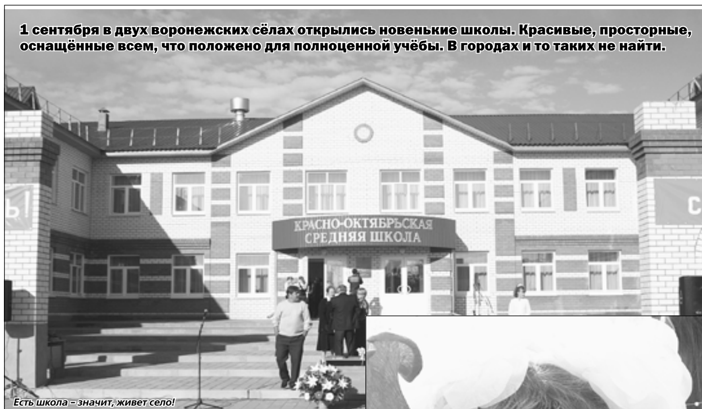
Есть школа - значит, живет село!

1 сентября в двух воронежских сёлах открылись новенькие школы. Красивые, просторные, оснащённые всем, что положено для полноценной учёбы. В городах и то таких не найти.