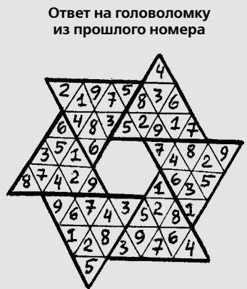
Ответ на головоломку из прошлого номера