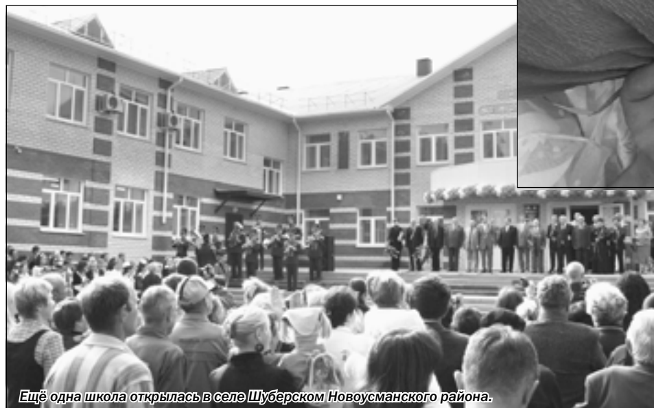
Ещё одна школа открылась в селе Шуберском Новоусманского района.

Всего в День знаний в Воронежской области распахнули свои двери 922 образовательные школы. Они приняли 202 тысячи мальчишек и девчонок, 18 тысяч из них переступили школьный порог впервые. Средняя наполняемость классов в городской местности - 22 человека, в сельской - 11 человек. На одного учителя приходится 10 учеников.