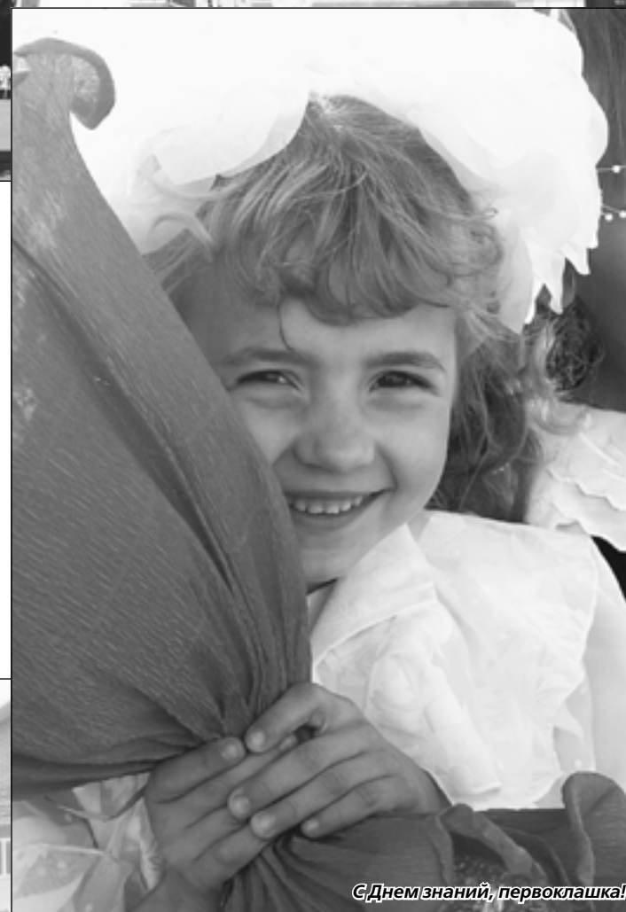
С Днём знаний, первоклашка!