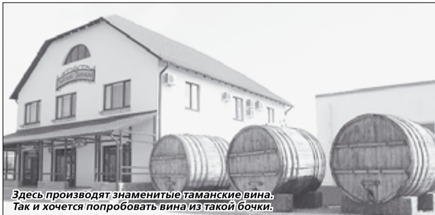
Здесь производят знаменитые таманские вина. Так и хочется попробовать вина из такой бочки.

На 2600-летие в Тамань прибыло около 40 тысяч гостей. Праздничная программа поражала своим разнообразием и масштабом: четыре дня гуляла станица. Сначала прошли литургия и крестный ход. Затем состоялось театрализованное представление: «Тамань античная», «Тмутаракань», «Тамань казачья», «Тамань лермонтовская», «Тамань современная». В праздничной программе принимали участие профессиональные и самодеятельные творческие коллективы, ансамбли, хоры духовой музыки и участники исторических клубов. Представления проходили на