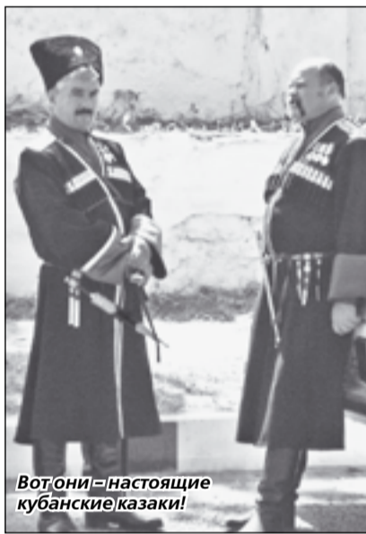
Вот они – настоящие кубанские казаки!