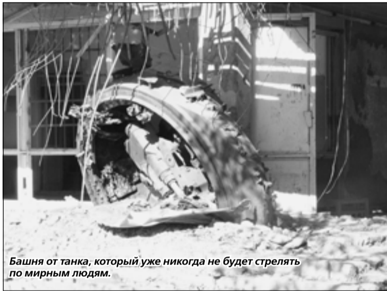
Башня от танка, который уже никогда не будет стрелять по мирным людям.

Пересекли жилой массив, в котором находится пивной завод.