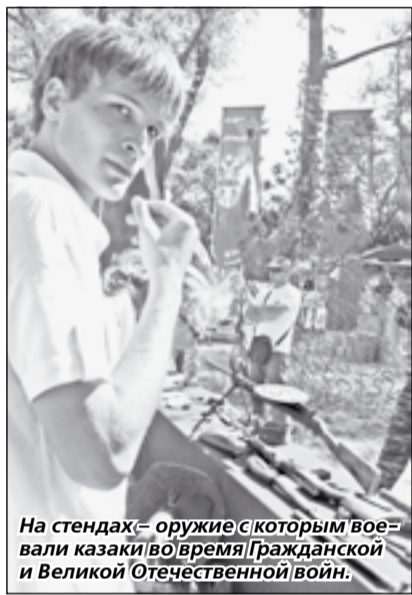
На стендах – оружие с которым воевали казаки во время Гражданской и Великой Отечественной войн.