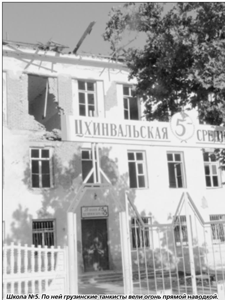
Школа №5. По ней грузинские танкисты вели огонь прямой наводкой.

К вечеру со стороны республиканской больницы, а находилась она по соседству с развернувшимся госпиталем МЧС, раздались женские рыдания. Большая группа осетинок пришла на опознание убитого накануне снайпером парня. Тот направлялся к границе, но не доехал до своих. Женщин пытались успокоить. Но как? Убитый