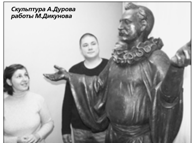
Скульптура А.Дурова работы М.Дикунова