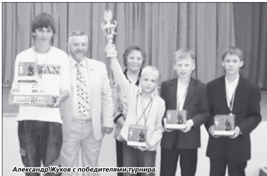
Александр Жуков с победителями турнира.