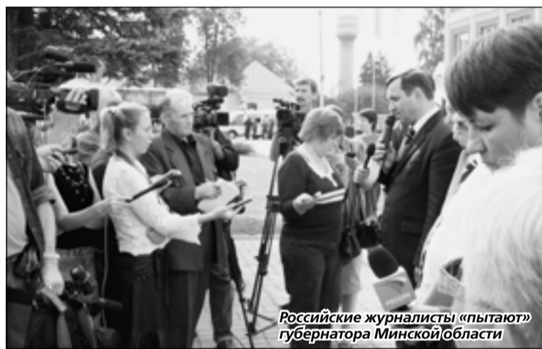
Российские журналисты «пытают» губернатора Минской области