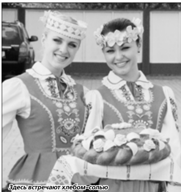
Здесь встречают хлебом-солью

Недавно я в очередной раз ездил в Беларусь. Национальный пресс-центр братской нам республики завел правило ежегодно приглашать к себе в гости большие группы российских журналистов, в первую очередь из региональных газет и телерадиокомпаний. Цель – познакомить с жизнью белорусов, с достопримечательностями этого государства, расположенного в самом центре Европы. Мне повезло: ранее вместе со своими коллегами удалось посетить легендарную Брестскую крепость, Беловежскую пуцу, многие города и села, конечно же, саму столицу – Минск, который смею назвать одной из самых ухоженных столиц мира.