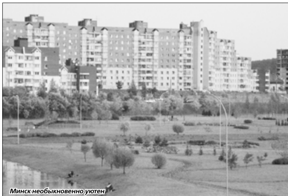
Минск необыкновенно уютен