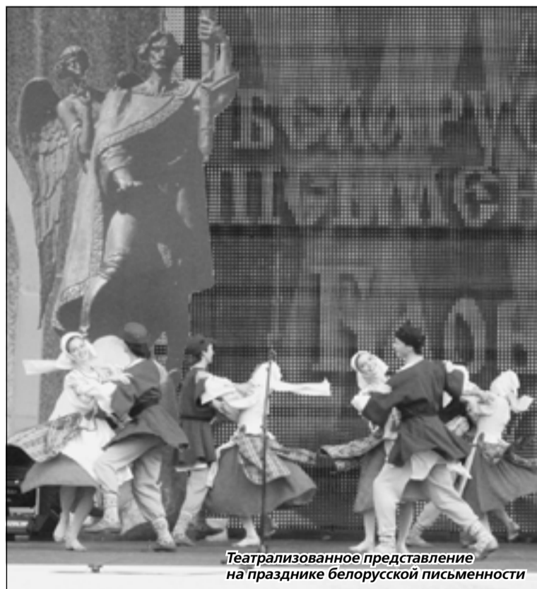
Театрализованное представление на празднике белорусской письменности