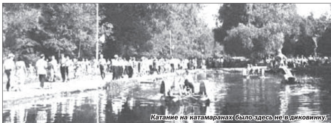
Катание на катамаранах было здесь не в диковинку.