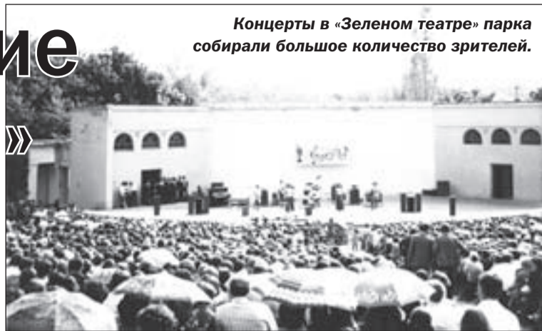
Концерты в «Зеленом театре» парка собирали большое количество зрителей.