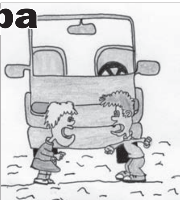
Порой именно так и происходят выяснения отношений на перекрестках.

Перекресток у памятника Славы – по праву можно считать «перекрестком семи дорог». Отсюда поток машин рассредотачивается по всему Север-