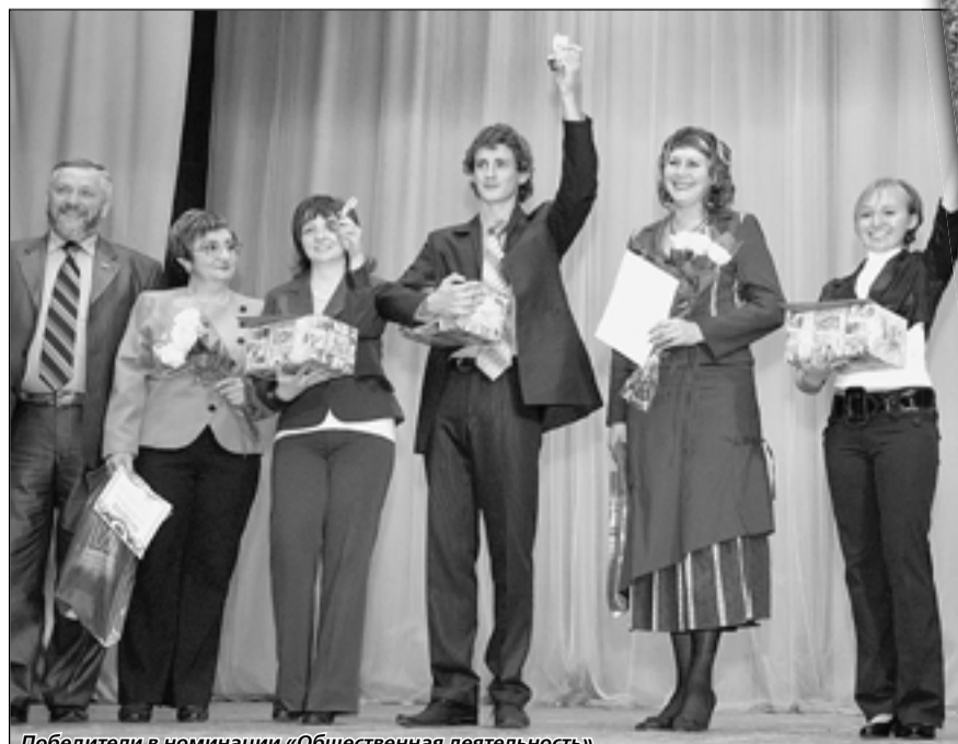
Победители в номинации «Общественная деятельность»