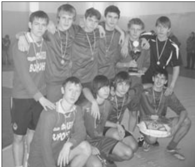
Победители турнира, футболисты из школы № 87.