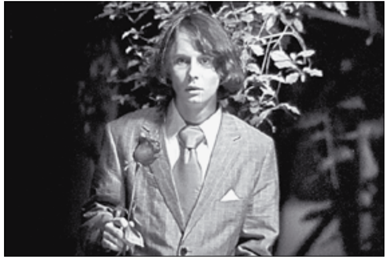
Кадр из фильма «Высокие чувства».

Картина «Утрата» получила приз фестиваля «АРТкино» как лучший фильм об искусстве. Главные герои