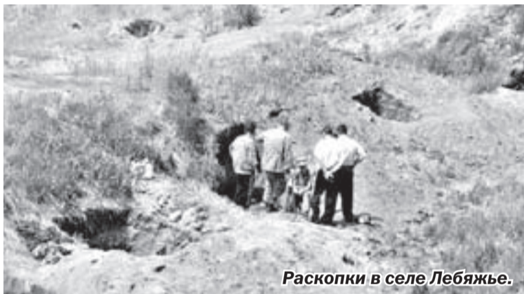
Раскопки в селе Лебяжье.

В своих воспоминаниях маршал А. Василевский написал: «Ставка передала в распоряжение Брянского фронта 5-ю танковую армию... однако она никаких задач от командования фронта не получила».