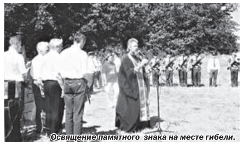
Освящение памятного знака на месте гибели.