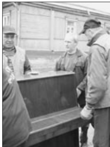
Через несколько минут подарок от фонда «Доброта» займет место в комнате своей маленькой хозяйки.