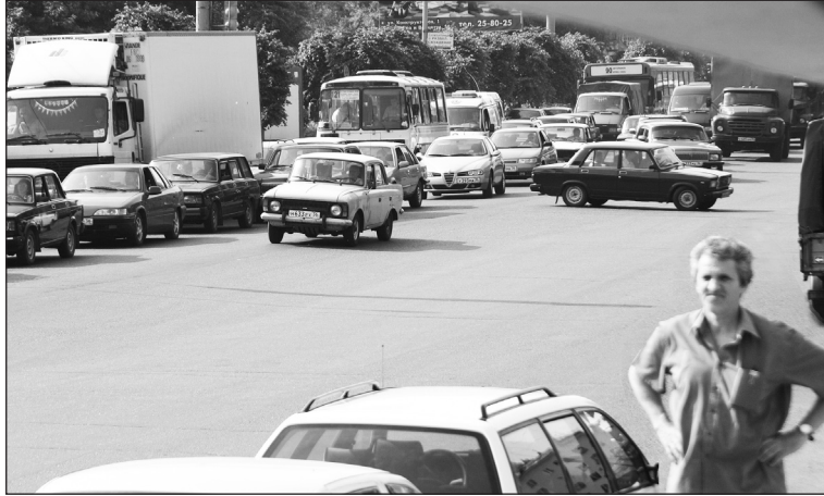
На «сигналку» надейся, но сам не плошай!

- Уточню - похитители. В этом деле одиночки - редкость. Чаще всего работают несколько че-