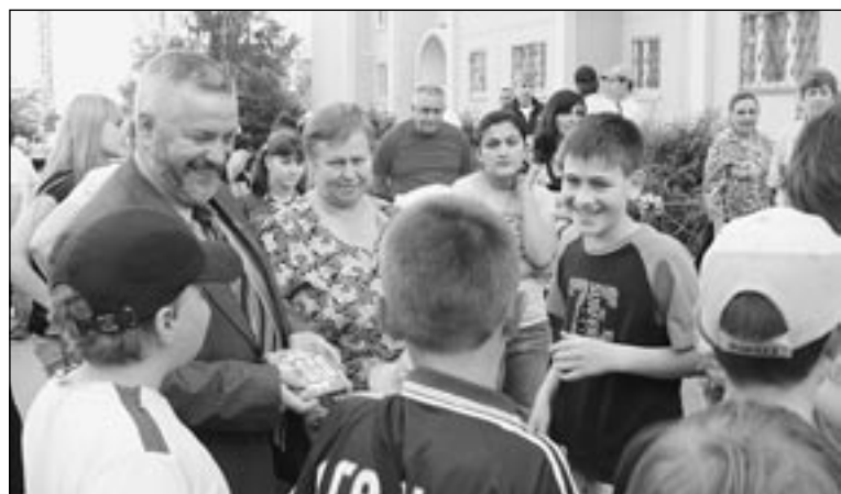
На празднике двора депутат поздравил юных коминтерновцев с их детским праздником.