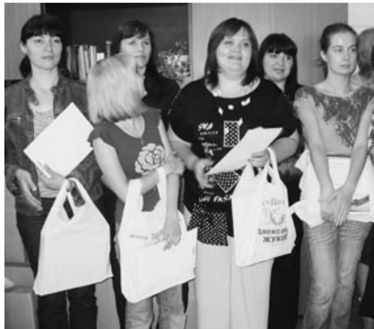
Творить добро – их призвание.