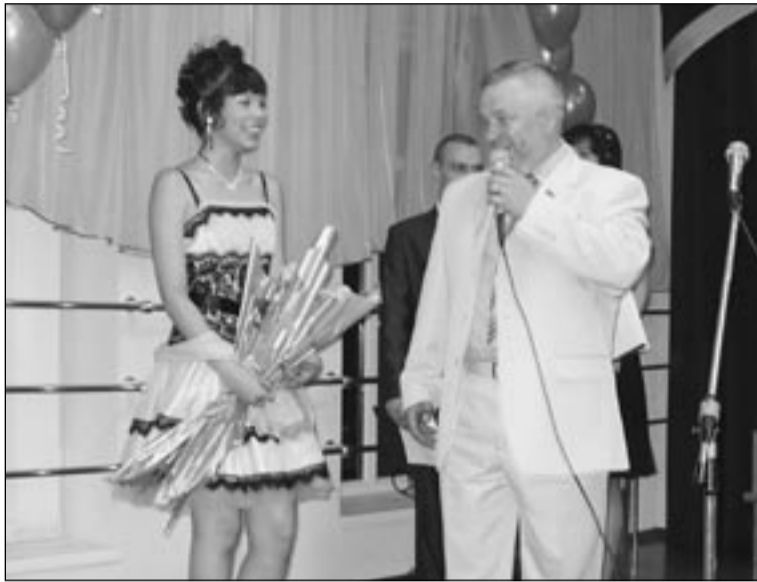
В добрый путь, выпускники!

Одним из первых на просьбу о помощи откликнулся вице-