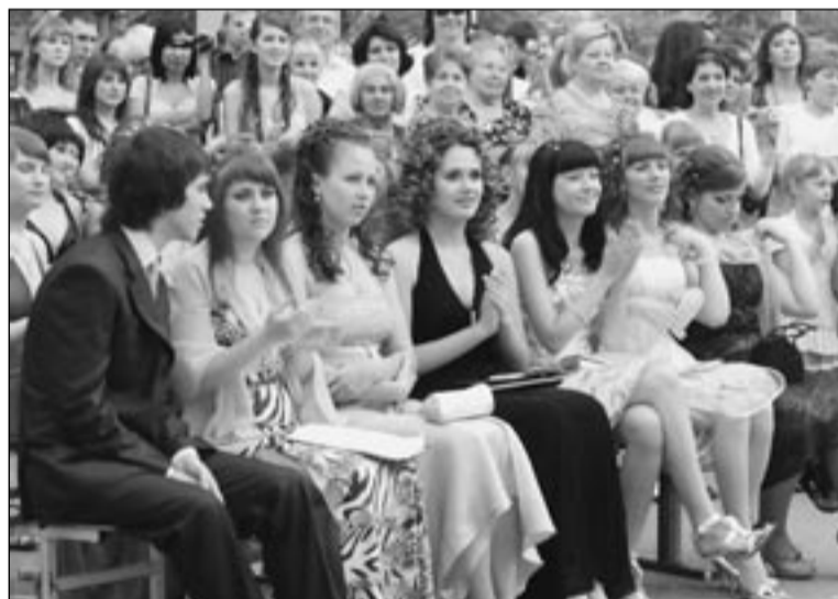
В такой день хочется быть особенно красивым.