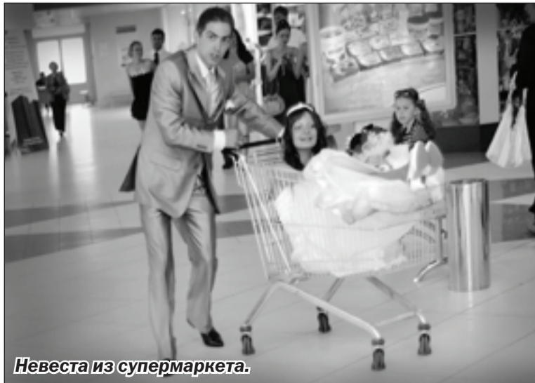
Невеста из супермаркета.