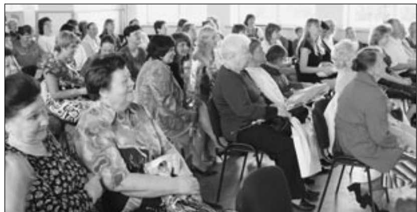
На встрече с депутатом.