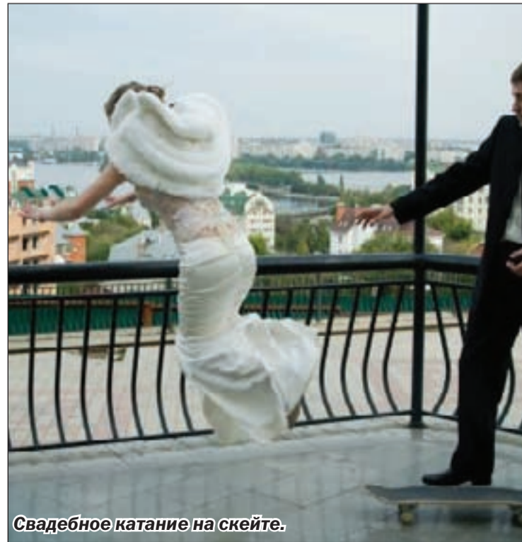
Свадебное катание на скейте.