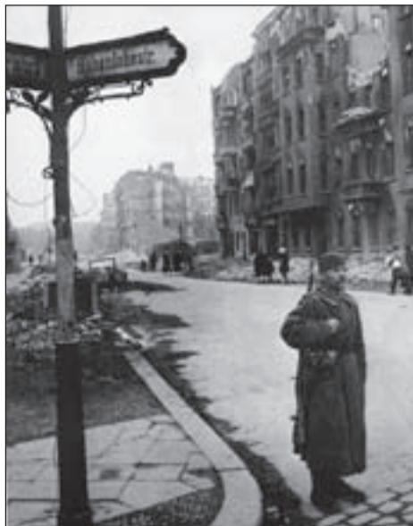
Первые мирные дни Берлина. Май 1945.

- По правде сказать, в поле, братцы, хочется, на вольный простор... Небо синее... жаворонки звенят... хлеб колышется... Дышать легко! Я же прицепщиком в тракторном отряде работал во время школьных каникул