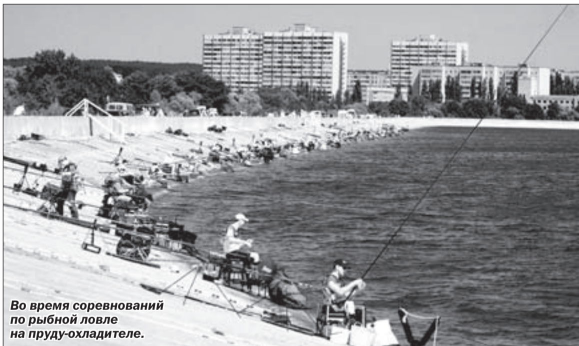
Во время соревнований по рыбной ловле на пруду-охладителе.