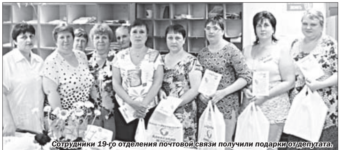
Сотрудники 19-го отделения почтовой связи получили подарки от депутата.