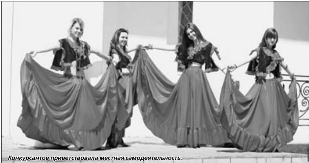
Конкурсантов приветствовала местная самодеятельность.

Первое задание четырёхчасового марафона называлось «И с ней неумоги, и без неё беда!».