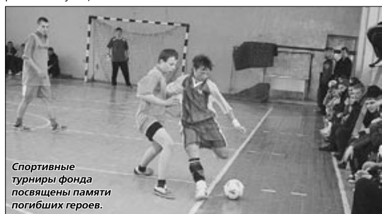
Спортивные турниры фонда посвящены памяти погибших героев.

Около 180 тонн пестицидов, представляющих огромную опасность для людей и окружающей среды, находятся в полуразобранном ангаре и более 120 тонн – в строительных цогах. Среди них немало и ртутьсодержащих пестицидов – гранозана (около 20 тонн). Всё это выявилось в ходе проверки Управления Россельхознадзора по Воронежской и Волгоградской областям в Хохольском районе. Управление готовит обращение в прокуратуру области для принятия мер.