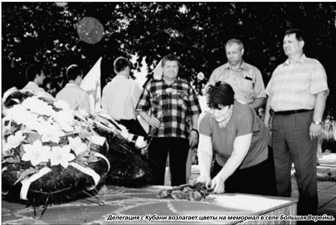
Делегация с Кубани возлагает цветы на мемориал в селе Большая Верейка.