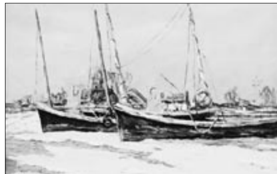
А. Захаров. Соимы. В рыбацком поселке