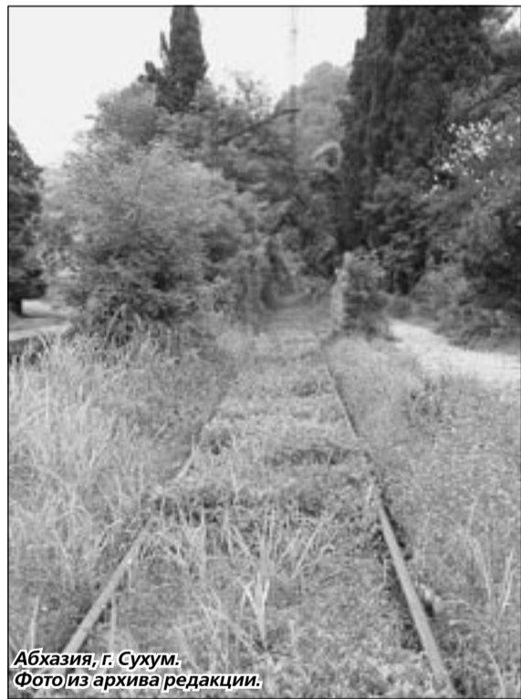
Абхазия, г. Сухум.