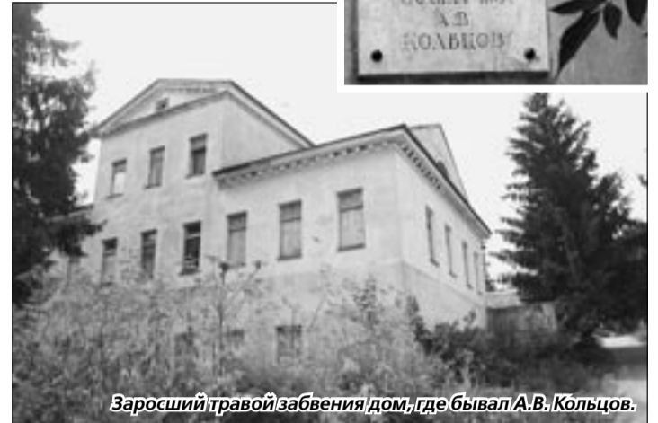
Заросший травой забвения дом, где бывал А.В.Кольцов.