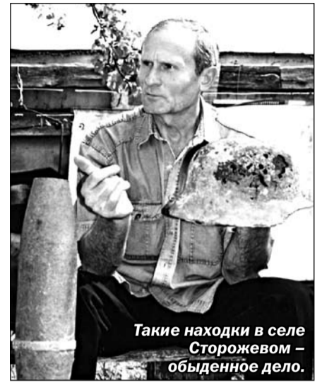
Такие находки в селе Сторожевом – обыденное дело.