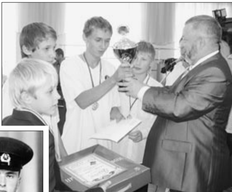
Кубок – чемпионам из школы №51.