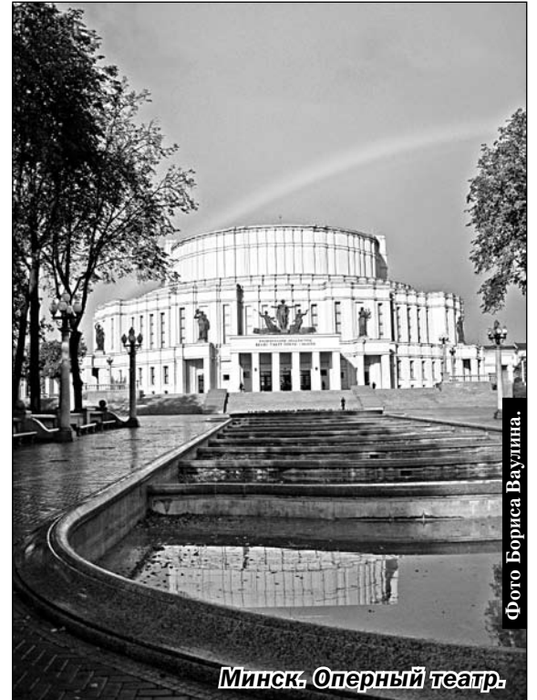
Минск. Оперный театр.