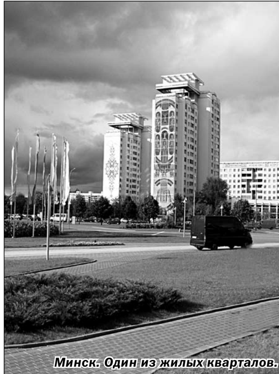
Минск. Один из жилых кварталов.

Что касается пресловутой «молочной войны», то, по словам Александра Григорьевича, возникла она потому, что «на границе под надуманным предлогом неправильно оформленных документов были остановлены полторы сотни рефрижераторов со скоропортящейся молочной продукцией, которые шли в Россию. Мы просили: давайте оставим выяснение отношений хотя бы на неделю, пропустите эти машины, а потом начнем разбираться с документами. Если не хотите, мы не будем поставлять в Россию нашу молочную продукцию, но зачем же эти продукты в 150 машинах гноить, ведь потом их даже свиньям не скормишь. Не пропустили. Это был откровенный выпад против Белоруссии. А дело в том, что на одной из встреч Владимир Владимирович Путин мне говорит, что у нас, мол, недобросовестная конкуренция выходит: вы привозите