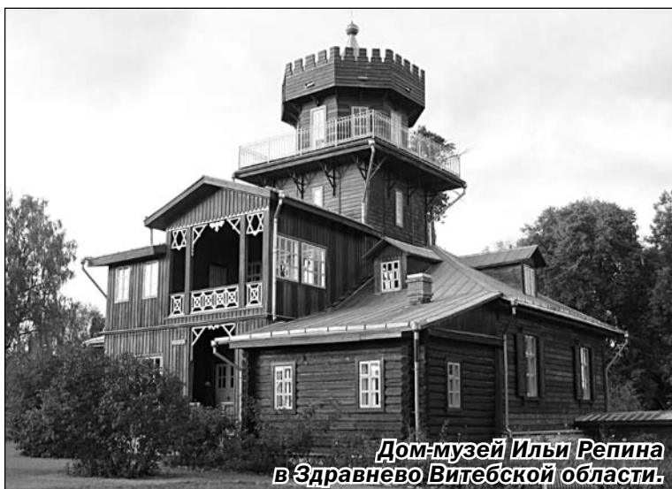
Дом-музей Ильи Репина в Здравнево Витебской области.