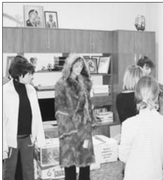
А теперь – показ мод!