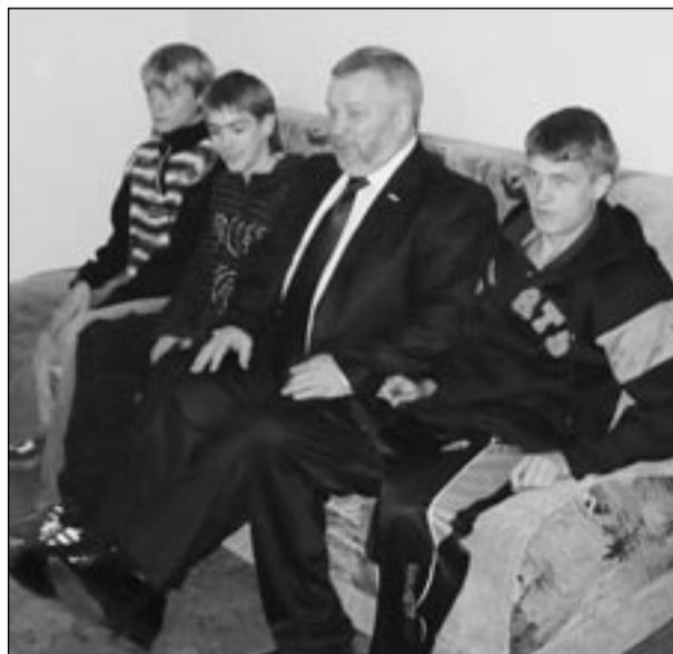
На новом диване смотреть телевизор будет теперь намного уютнее.