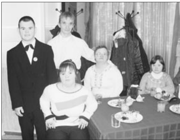
Праздник в кафе – хорошая возможность пообщаться с друзьями.