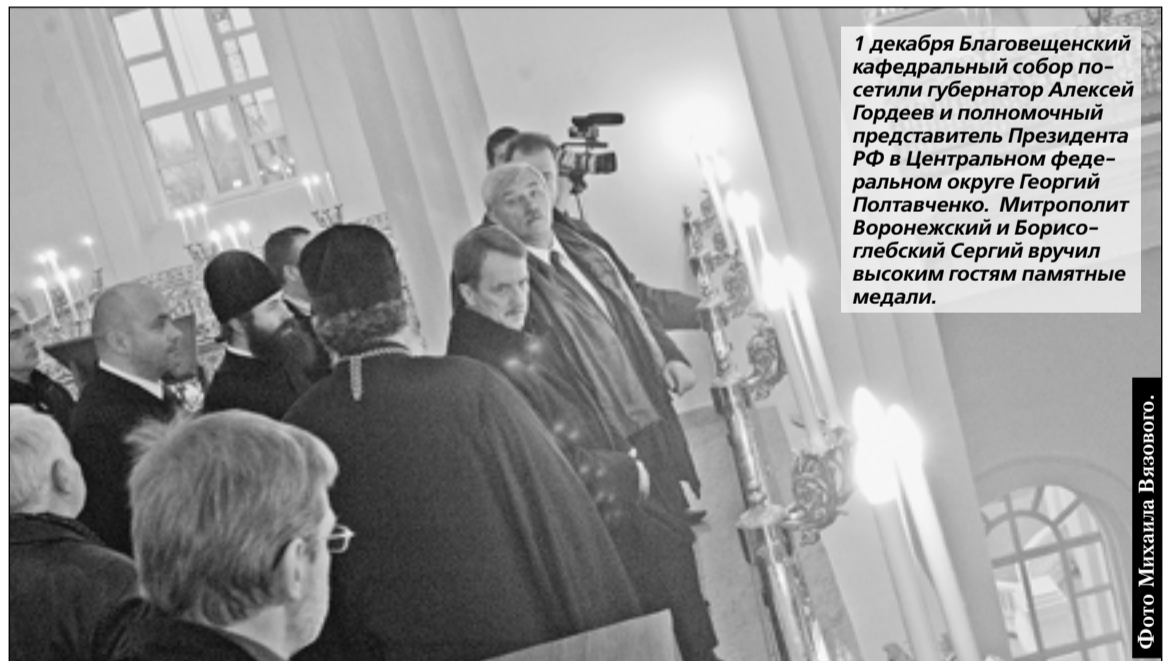
1 декабря Благовещенский кафедральный собор посетили губернатор Алексей Гордеев и полномочный представитель Президента РФ в Центральном федеральном округе Георгий Полтавченко. Митрополит Воронежский и Борисоглебский Сергей вручил высоким гостям памятные медали.

Пресс-центр губернатора и правительства области.