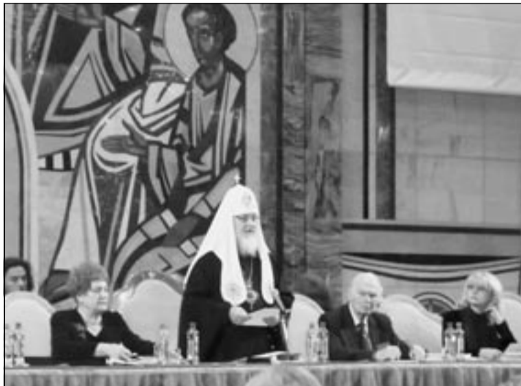
Патриарх Московский и всея Руси Кирилл открыл Форум православных женщин благословением.

История Православной церкви насчитывает немало женщин-подвижниц, женщин-святых, ратовавших наравне с мужчинами за укрепление и сохранение не только православной веры, но и государственности, образования. Да и в наши дни уже нет ни одной сферы бытия, где дамы не проявляли бы инициативу. Однако женщина не должна в стремлении к профессиональным достижениям пренебрегать своим семейным призванием, заявил Патриарх Московский и всея Руси Кирилл, а закончил выступление напутствием Иисуса Христа: «Держай, дочерь!», которое содержало в себе весомый смысл для всех, кто приехал на форум.